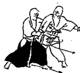
Ude kime nage