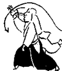
Flere kokyu nager